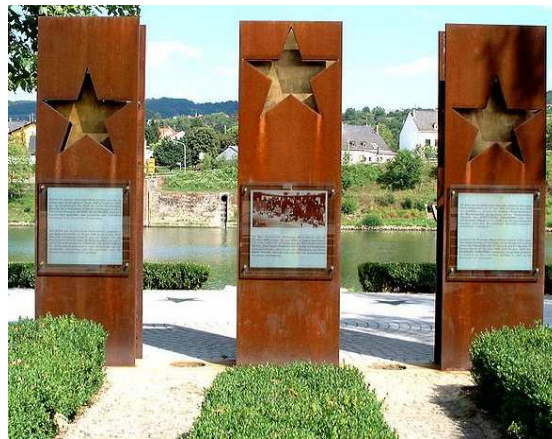
Europadenkmal (zur Erinnerung an das Schengener Abkommen)

Allerdings sollte es noch zehn Jahre und ein weiteres Abkommen benötigen – das Schengener Durchführungsübereinkommen von 1990 (Schengen II) –, bis die rechtlichen und verwaltungstechnischen Voraussetzungen zur Umsetzung des Schengener