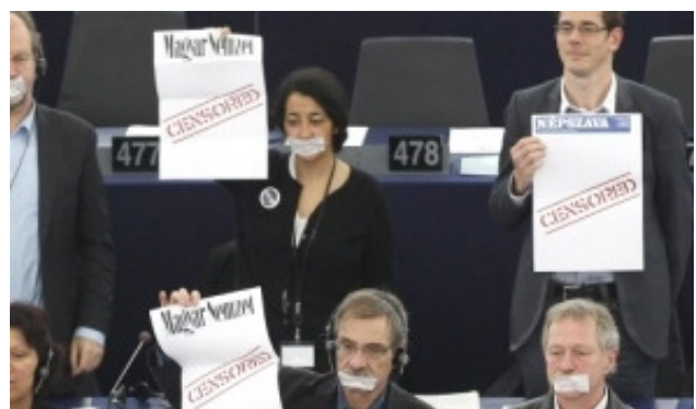
Abgeordnete der Grünen-Fraktion demonstrieren gegen das Mediengesetz

Dass die Mehrheit der Parlamentarier dem Ministerpräsidenten mit Misstrauen begegneten, hat vielmehr mit einem Mediengesetz zu tun, das die ungarische Regierung am 20. Dezember vergangenen Jahres verabschiedet hat. Seitdem steht die Regierung in Budapest unter „Dauerbeschuss“, denn Kritiker sehen in den Regelungen