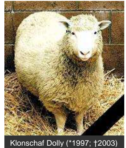
Klonschaf Dolly (*1997; †2003)

Studie von 2008 über das Klonen von Tieren durch die Europäische Agentur für Lebensmittelsicherheit (EFSA): http://www.efsa.europa.eu/de/press/news/sc080724.htm